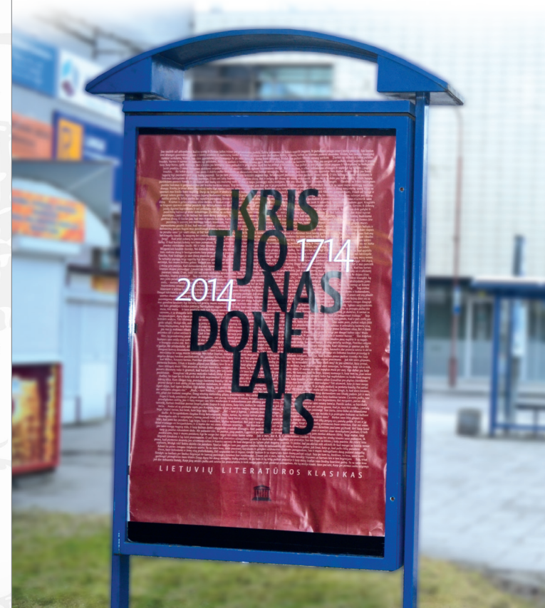
Kristijonui Donelaičiui skirtas reklaminis stendas Šiaulių miesto Tilžės gatvėje