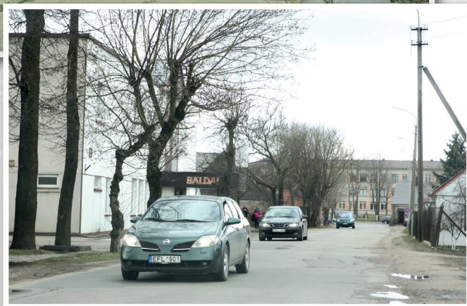
Kristijono Donelaičio gatvės vaizdai, 2014 balandis.